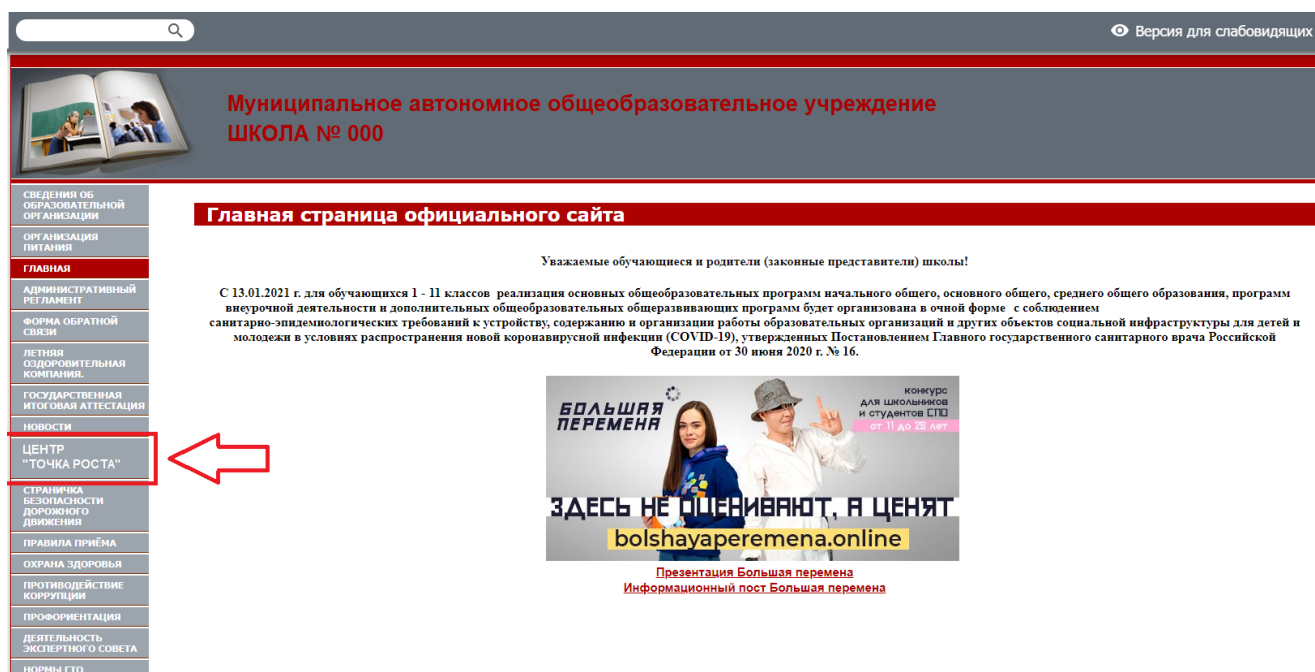
Рисунок 2. Пример размещения ссылки на раздел на сайте общеобразовательной организации

На официальном сайте общеобразовательной организации, в которой создается центр образования естественно-научной и технологической направленностей «Точка роста» (далее – центр «Точка роста», центр) в рамках федерального проекта «Современная школа» национального проекта «Образование», не позднее даты начала функционирования центра (не позднее 1 сентября года создания центра) создается раздел «Центр «Точка роста». Ссылка на раздел размещается в главном меню сайта общеобразовательной организации и должна быть видима при просмотре каждой страницы. Ссылка не может являться вложенной в другие меню. Пример размещения ссылки на раздел «Центр «Точка роста» в меню официального сайта общеобразовательной организации в информационно-телекоммуникационной сети «Интернет» приведен на рисунке 2.